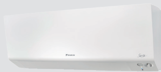
ATXM-R / FTXM-R