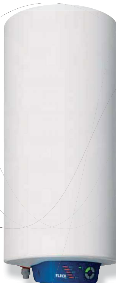
Bon 100 litros