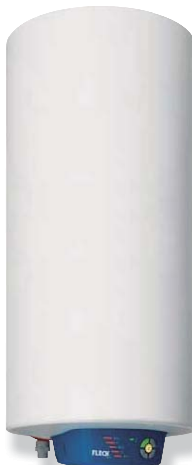
Nilo 100 litros