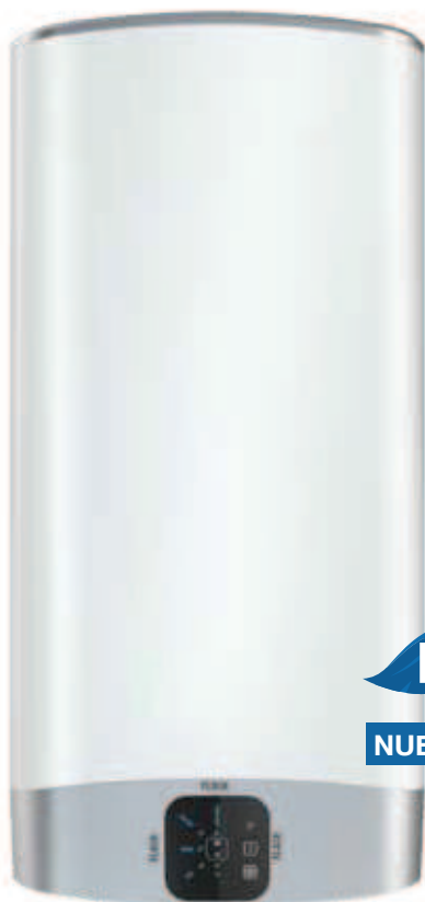
DUO5 80 LITROS